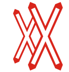
Fig. 10/D art. 87 DOPPIA CROCE DI S. ANDREA VERTICALE