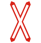
Fig. 10/C art. 87 CROCE DI S. ANDREA VERTICALE